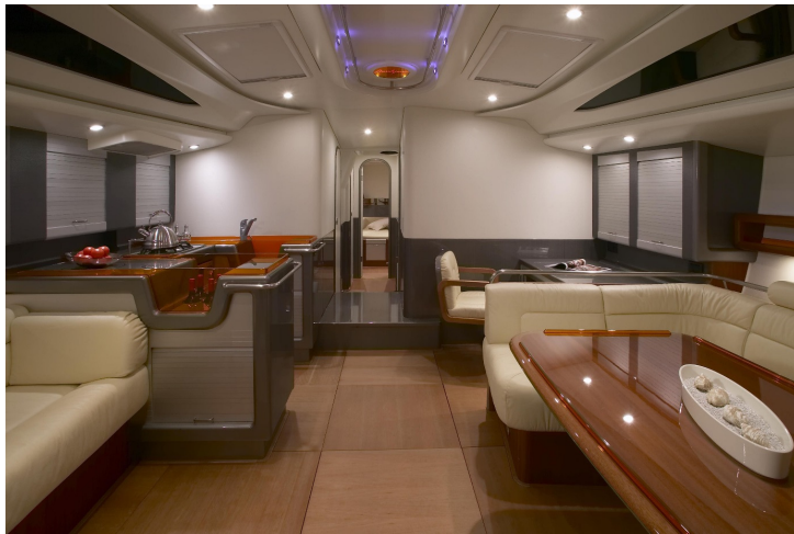
FIGURE 1. Intérieur de bateau (TopSolid) : rien n'est droit, tout est design et formes polynomiales.

Design. — Il s'agit de modéliser géométriquement une forme, délimitée par des surfaces supportées par une structure topologique en fil de fer (complexe simplicial).