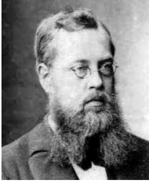
Sophus Lie (1842-1899)