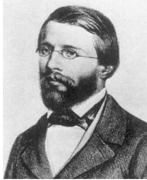
Bernhard Riemann (1826-1866)