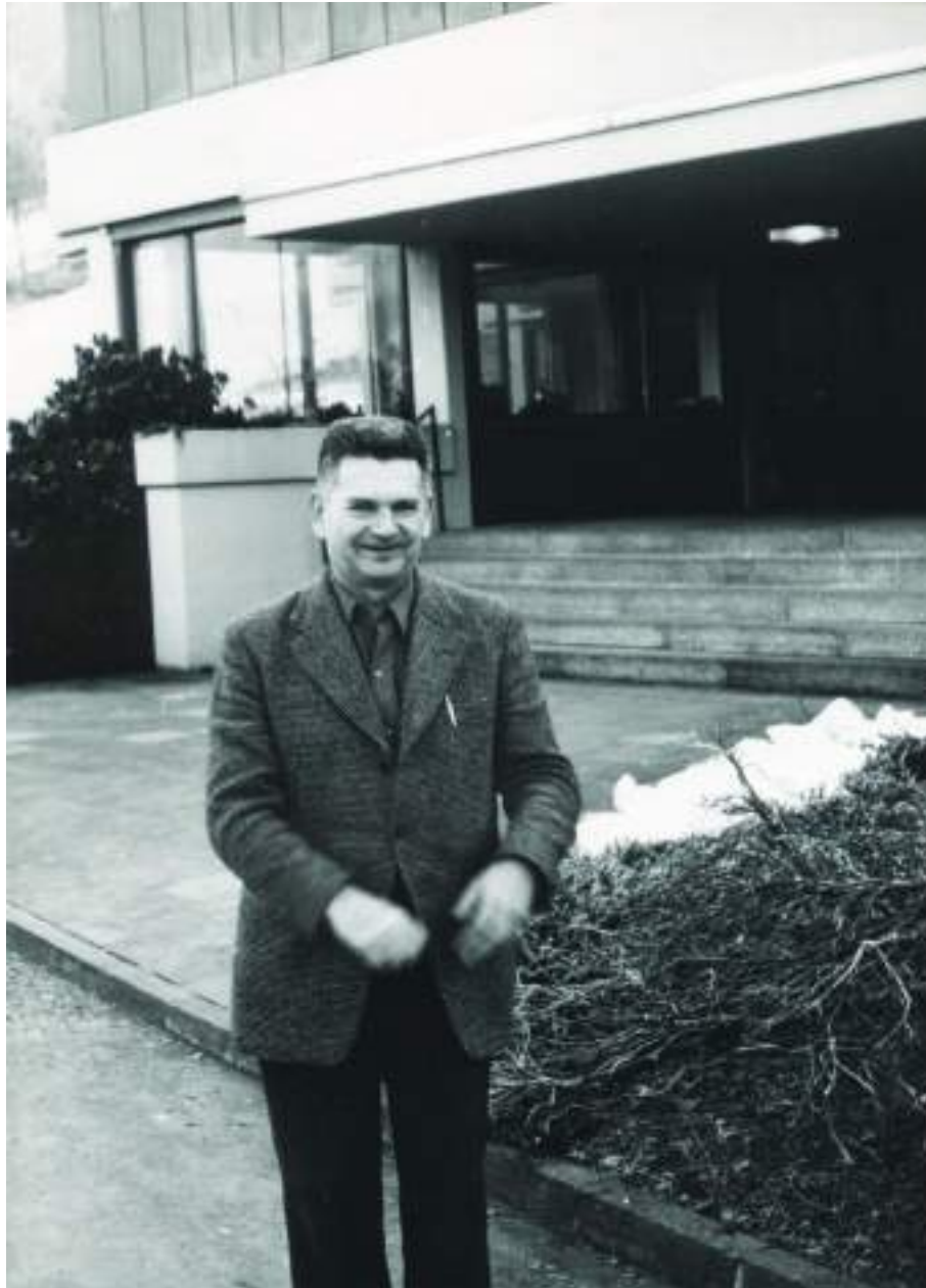
En 1977 devant le Forschungsinstitut Oberwolfach