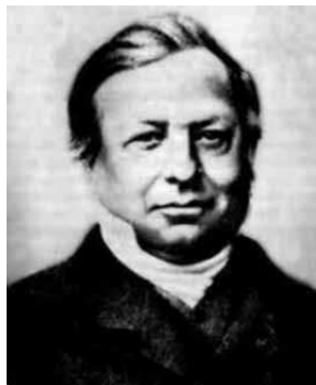
Joseph LIOUVILLE (1809–1882)

Cela implique en particulier que les trajectoires de n'importe quel hamiltonien du système sont des droites s'enroulant sur un tore horizontal et parcourues à vitesse constante (mais dépendant du tore considéré).