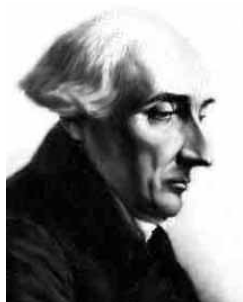
Joseph Louis LAGRANGE (1736–1813)

exemples non moins célèbres comme les toupies (Lagrange, Kovalevskaya), les billards ellipsoïdaux, le problème de C. Neumann, etc. (consulter par exemple le livre [115]).