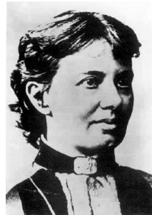
Sophia KOVALEVSKAYA (1850–1891)

Avant d'entrer dans le vif du sujet, je me propose de situer dans leur cadre historique les notions qui vont nous intéresser et qui concernent l'étude des systèmes complètement intégrables en mécanique classique et quantique.