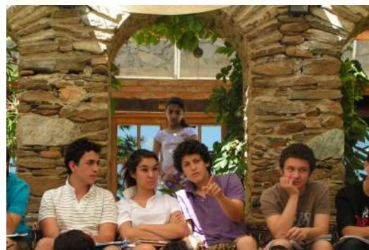
FIGURE 6 – Le garçon au T-shirt violet suit la solution et l'explique à ses collègues.