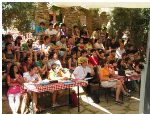
FIGURE 3 – Étudiants et profs de lycée suivent une classe à l'air libre.

Comme le personnel permanent est très peu nombreux, le village est organisé sur le modèle d'une coopérative. À l'arrivée, les étudiants sont répartis dans des groupes qui comptent des étudiants d'université et de lycée en parts plus ou moins égales. Pendant les deux semaines qui suivront, ils aideront à accomplir les tâches nécessaires au fonctionnement du village. Un groupe peut aider le cuisinier à éplucher des pommes de terre un jour, ramassera les poubelles le suivant, veillera au réapprovisionnement des distributeurs d'eau le troisième, et ainsi de suite. Non seulement les étudiants ne se plaignent pas de ce travail, mais le fait d'avoir ainsi contribué à la vie du village leur donne un sentiment d'appropriation et de communauté qui ne les quitte pas pendant de longues années.