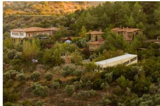
FIGURE 2 – Vue panoramique du Village. Les deux dômes bleus (l'un est à peine visible) sont les bains turcs. Le grand bâtiment à gauche est la bibliothèque.

qui aujourd'hui fournissent l'ombre si nécessaire furent plantées dès cette époque.