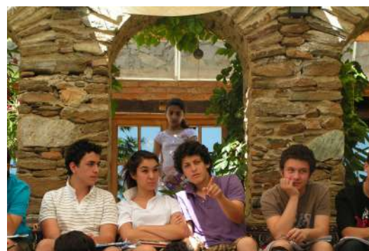
FIGURE 6 – Le garçon au T-shirt violet suit la solution et l'explique à ses collègues.